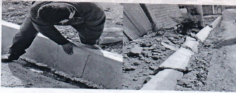
Fisuras y colapso de bordillos