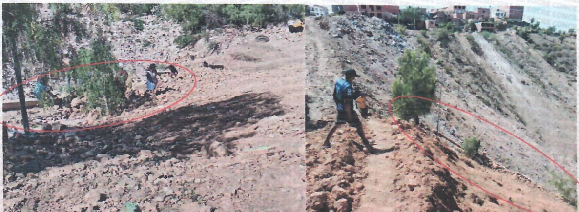
Escalinata rellena por material de corte

Plaza 25 de mayo No 1 64 51081 - 64 52039 - (0591) (4)-6440926 concejo_municipal_sucre@hotmail.com