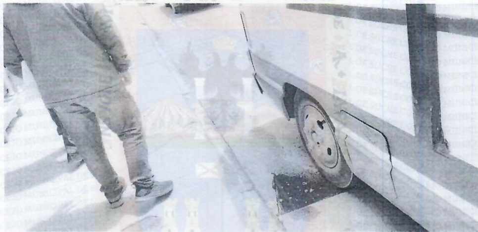
Desprendimiento de la Losa

Por otro lado, se ha podido advertir que en la calle Junín entre la calle Ravelo y la Avenida Hernando Siles, se hace cada vez más evidente el desprendimiento de una losa del pavimento del resto de su paquete estructural, generando una filtración de aguas pluviales de gran magnitud, así mismo, en este tramo se ha podido advertir el hundimiento de una parte de la acera y de la losa del pavimento que dificulta el transitar de los vehículos y de los peatones.