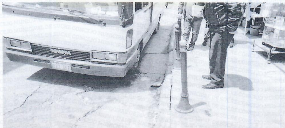
Hundimiento de la acera y pavimento