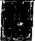
Figura 1 de 1 AM 3791209

Art.10º Remitir una copia de la Documentación al Banco de Datos y Archivos del H. Concejo Municipal de Sucre.