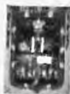
Figura 1 de 1 RM Nº 481/09