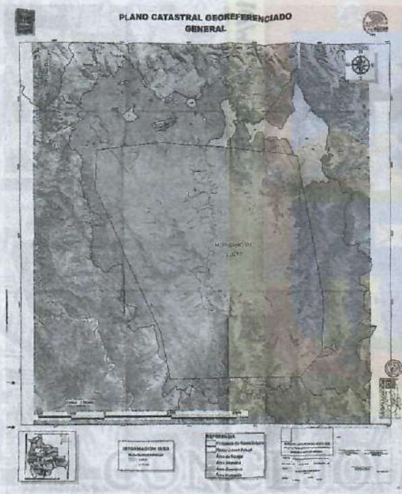
DOCUMENTO REMITIDO EN INF. "RESPUESTA A NOTA N° C – 160/2026 CITE SMTUV N° 25/2026"

Que, En la respuesta brindada a la nota H.C.M. Alc. N° 07/26, a los numerales 18, 19 y 20, a través informe denominado "RESPUESTA A NOTA N° C – 160/2026 CITE SMTUV N° 25/2026", presenta tres planos que no corresponden a lo solicitado , pues la fecha que tienen inscrita los mismos es mayo del 2013 y la poligonal que supuestamente delimita el área urbana de Sucre, no corresponde al radio urbano en actual vigencia que fue aprobado por Ley Municipal Autónoma N° 25/14, cuyos planos datan de marzo del año 2014; existiendo una sustancial diferencia entre el polígono remitido y el polígono que realmente corresponde al radio urbano que se encuentra en vigencia y las fechas de elaboración de los planos. Por lo tanto, los funcionarios remiten información errónea, incurriendo en contravenciones al ordenamiento jurídico, al aseverar que remiten copia legalizada del plano urbano catastral georreferenciado de la documentación de la ampliación del radio urbano de la ciudad de Sucre aprobado con la Ley Municipal Autónoma N° 25/2014 que reside en la Dirección de Planificación Territorial.