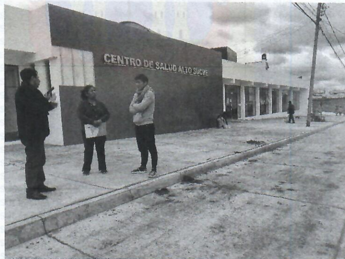
Calle Gerónimo Barón Galarza Inspección con los vecinos en la vía, punto 3 de observación, verificado la vía se encuentra consolidada que pasa por el centro de Salud Alto Sucre