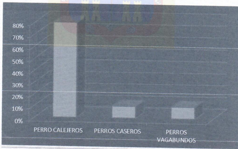
F. Elaboración propia datos Revista Ecos Correo del Sur 2019

8. Por otra parte, se advierte la insuficiencia de operatividad, compromiso social e institucional por parte de algunas instancias operativas del Ejecutivo Municipal.