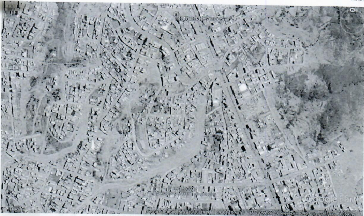
FIGURA 2 VISTA SATELITAL DE LA UBICACIÓN DEL PROYECTO