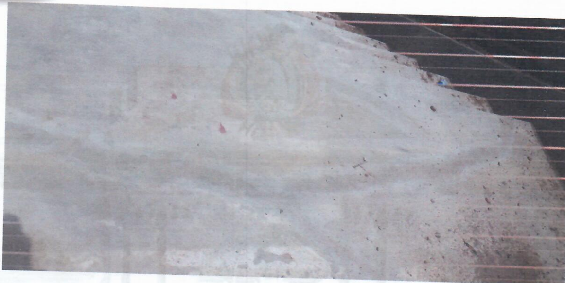
b).- CONSTRUCCIÓN POTEÓ QUEBRADA EL CHORRO J.V. ALTO HOYADA D-4