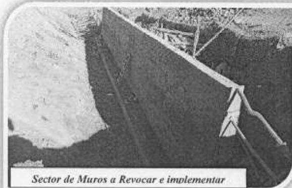
Sector de Muros a Revocar e implementar