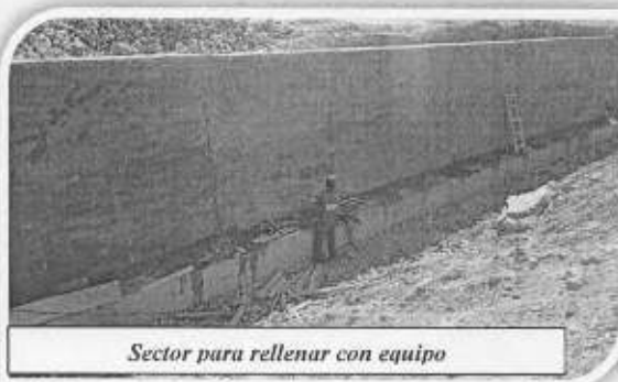
Sector para rellenar con equipo