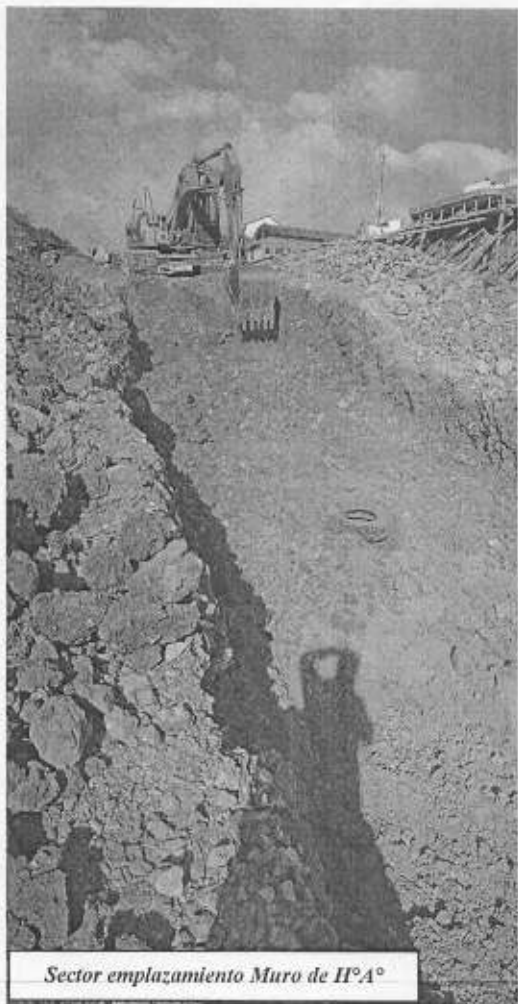
Sector emplazamiento Muro de H o A°