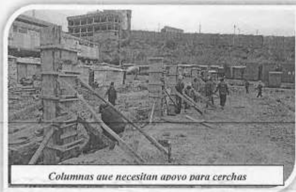
Columnas que necesitan apoyo para cerchas