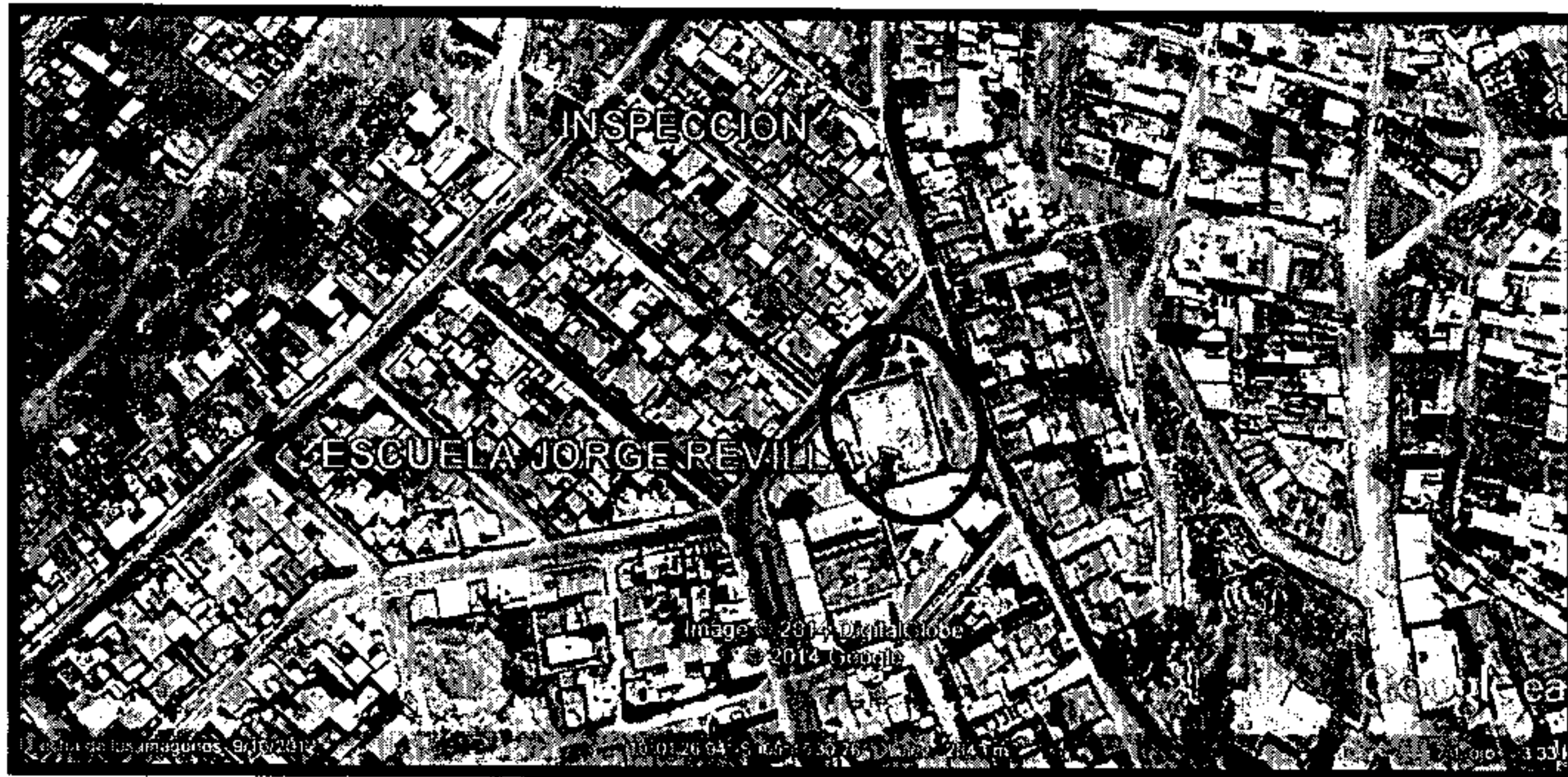
IMAGEN DE UBICACIÓN DEL PROYECTO "CONSTRUCCIÓN CAMPO DEPORTIVO ALTO DELICIAS D-2".

Que, de acuerdo a INFORME N°1336/13 elaborado por la unidad de MAPOTECA se tiene: "De acuerdo a documentación que adjunto (copia de plano de loteamiento y levantamiento), se certifica el sector con uso de suelo destinado a: área de equipamiento, propiedad del gobierno municipal de Sucre. " a fojas (242 a 244).