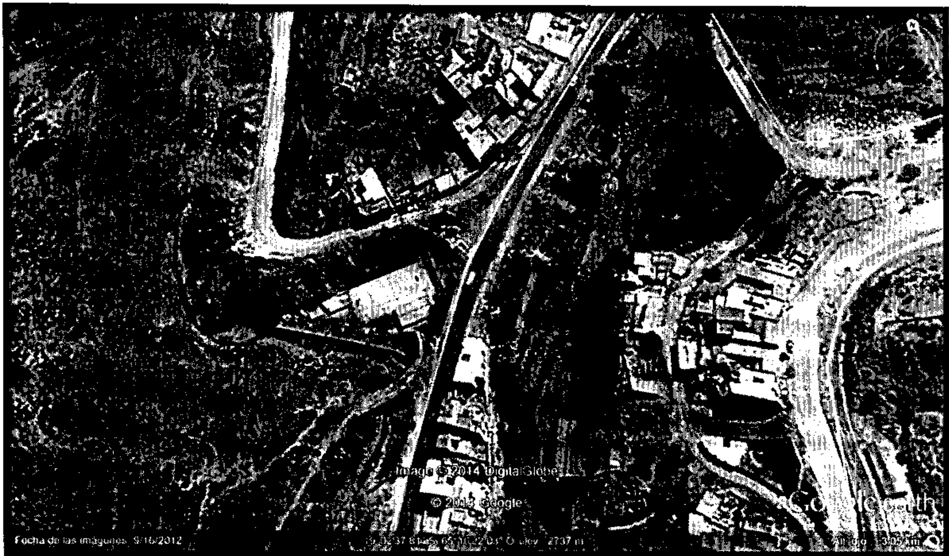
IMAGEN DE UBICACIÓN DEL PROYECTO "CONSTRUCCIÓN MURO DE CONTENCIÓN J.V. SAN JUAN DE DIOS BAJO D-4"

De acuerdo a documentación que adjunto (plano de lot.) se certifica el sector con uso de suelo municipal, propiedad del Gobierno de sucre.", a (fojas 070 a 071), como también CERTIFICACIÓN N° 119/014, EMITIDO POR LA DIRECCIÓN DE REGULARIZACION DE DERECHO PROPIETARIO- G.A.M.S.