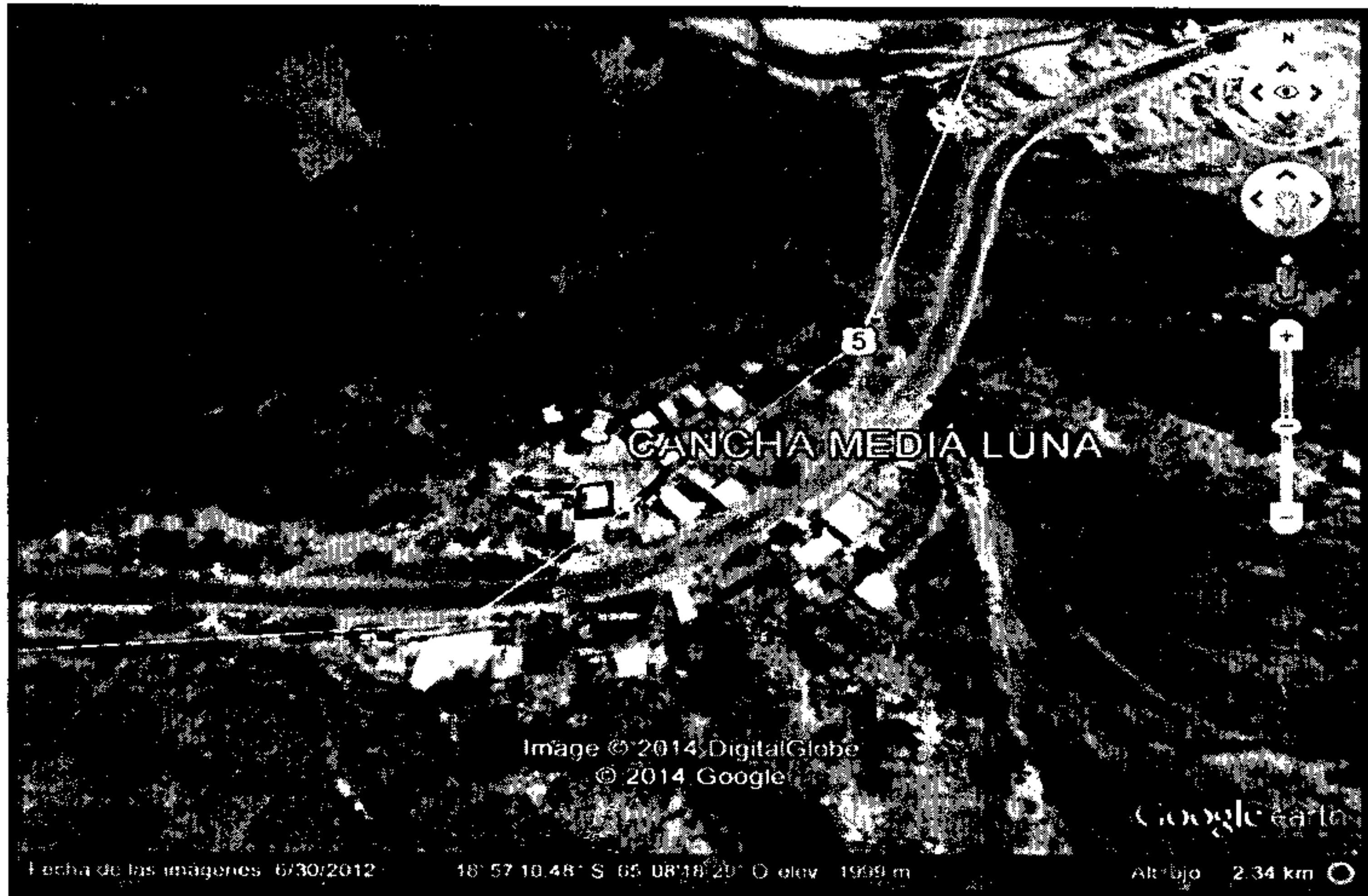
IMAGEN DE UBICACIÓN DEL PROYECTO "CONSTRUCCIÓN CANCHA DE FUTSAL MEDIA LUNA"

Que, en virtud a Testimonio N° 292/2014, de 30 de abril de 2014, relativa a DONACION DE UN LOTE DE TERRENO RUSTICO ubicado en la comunidad Media Luna, sector Naranjos Pampa, Cantón Mojotoro, Provincia Oropeza del Departamento de Chuquisaca con una superficie de 630 m 2 , por lo cual se acredita el Derecho propietario del G.A.M.S., correspondiente al área para el proyecto de "CONSTRUCCIÓN CANCHA DE FUTSAL MEDIA LUNA" , a (fojas 321 a 326).