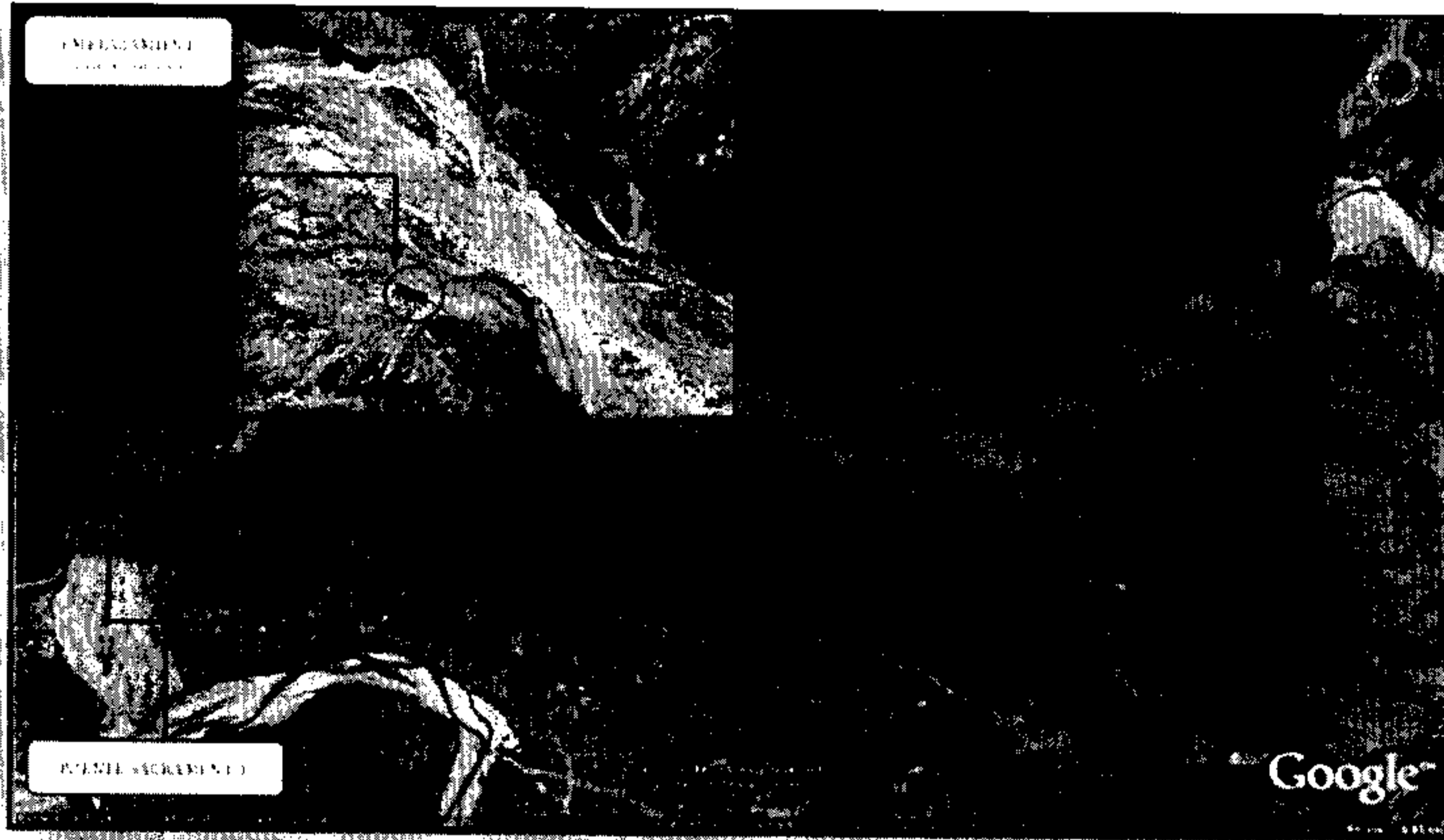
— IMAGEN DE UBICACIÓN DEL PROYECTO "CONSTRUCCIÓN MURO DEFENSIVO H°C° HUAÑOMA"