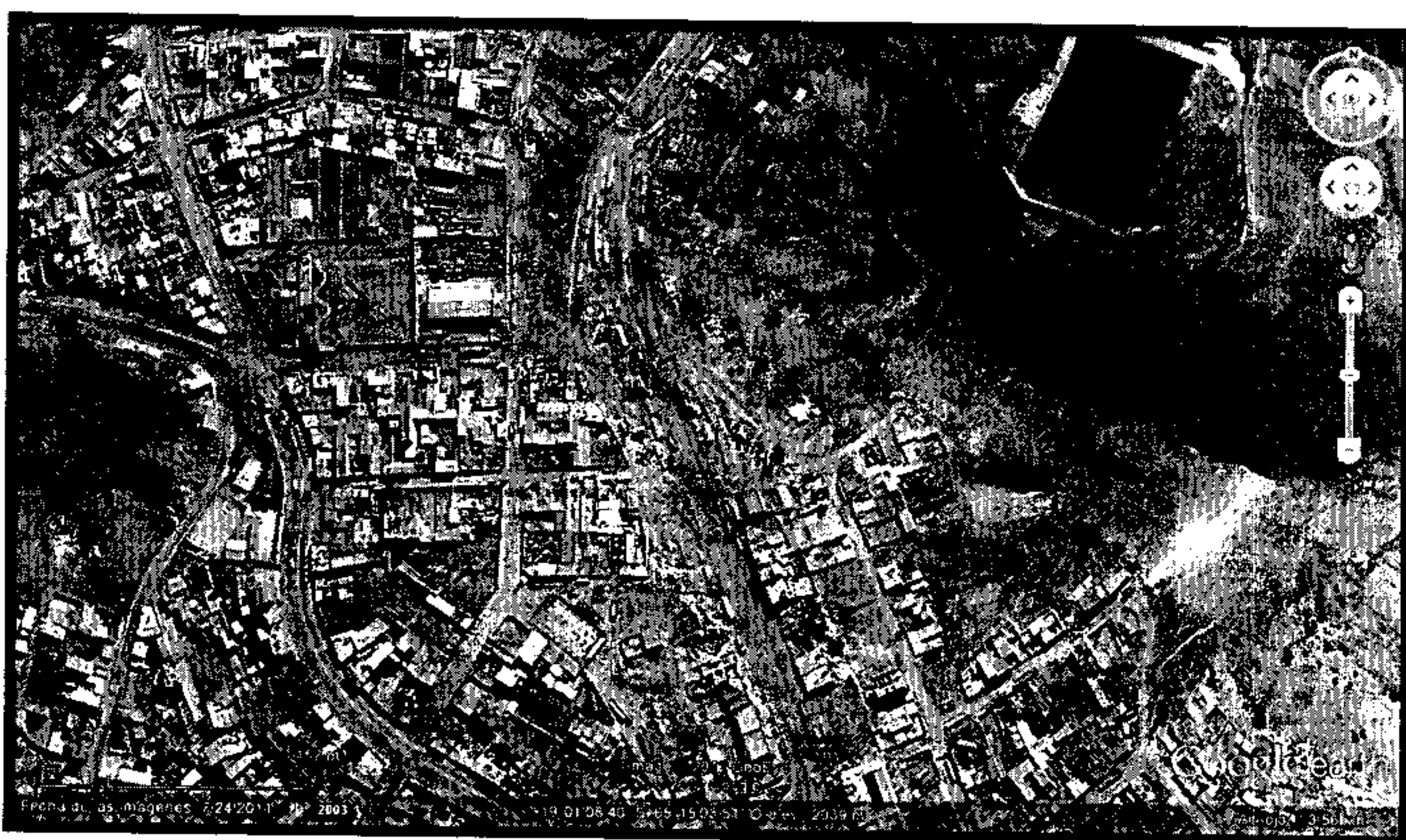
IMAGEN DE UBICACIÓN DEL PROYECTO "CONSTRUCCIÓN PAVIMENTO RÍGIDO CALLES SECTOR ADUANA"