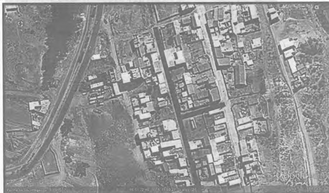
PLANO DE UBICACIÓN "CONSTRUCCIÓN PAVIMENTO RIGIDO CALLES S/D BARRIO VILLA ARMONIA B"