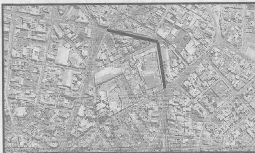
— PLANO DE UBICACIÓN "CONSTRUCCIÓN PAVIMENTO RÍGIDO PROLONGACIÓN AV. EMILIO MENDIZABAL"