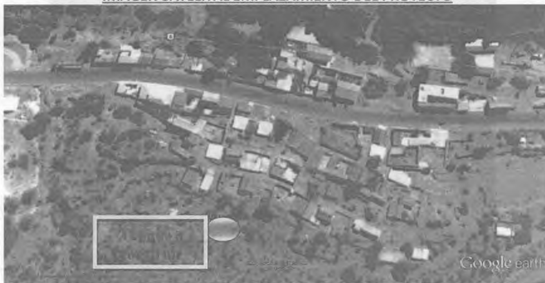
IMAGEN SATELITAL EMPLAZAMIENTO DEL PROYECTO

Que, con la ejecución del proyecto, se beneficiará de manera directamente a 1200 habitantes, que residen de manera permanente en la comunidad.