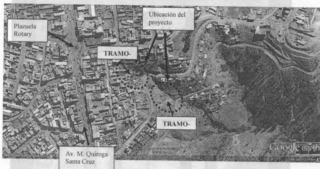
IMAGEN SATELITAL EMPLAZAMIENTO DEL PROYECTO

Por todo lo indicado, se observa a través de la fotografía satelital la ubicación, del emplazamiento del proyecto.