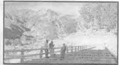
Ingreso lado Norte Maragua