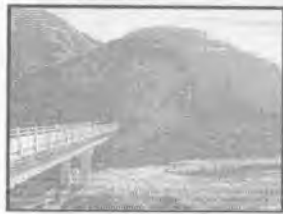
Ingreso lado Oeste

Que, el Contrato Modificatorio N° 01/2012 modifica el monto del CONTRATO PRINCIPAL C.D.J. N° 06/2011 del 16 de mayo de 2011 de la Obra " CONSTRUCCIÓN PUENTE VEHICULAR MARAGUA " D-8, a un total de 2'806.896,11 (DOS MILLONES OCHOCIENTOS SEIS MIL OCHOCIENTOS NOVENTA Y SEIS CON 11/100 BOLIVIANOS), con un plazo total de 292 días calendario incrementando 67 días calendario al contrato inicial, con un avance físico al 18 de julio de 90.05%, según planilla de avance N° 3, la empresa presenta boletas de garantía de Cumplimiento de Contrato y de Correcta Inversión de Anticipo ambas boletas renovadas hasta el 20 de noviembre de 2012, de acuerdo a inspección conjunta (supervisor de obra, Empresa Constructora R y P, Asesora Técnica y Asesora Económica de la COMISIÓN DE DESARROLLO ECONÓMICO, FINANCIERO, DE GESTIÓN ADMINISTRATIVA Y LEGAL , programada para el 22 de agosto a horas 14:30, se verifico el avance de obra, además se constató la necesidad del incremento de volúmenes en el ítem respaldado con el reporte fotográfico del proyecto.