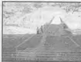
Ingreso lado Norte