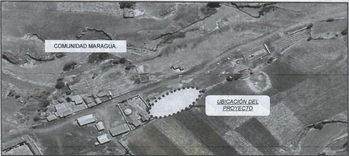
IMAGEN N° 2. MICRO LOCALIZACIÓN DEL PROYECTO

En cuanto a la situación legal del derecho propietario por las características del proyecto esta se constituirá como establece la LEY MUNICIPAL AUTONÓMICA N° 409/2024 “LEY DE EXPROPIACIÓN, DE LIMITACIONES ADMINISTRATIVAS Y SERVIDUMBRE DE LA PROPIEDAD EN EL MUNICIPIO DE SUCRE” DE 20 DE FEBRERO DEL AÑO 2024, sancionado por el Órgano Legislativo, tiene por objeto establecer disposiciones para la expropiación de bienes ubicados en el Municipio de Sucre por causas de Necesidad y Utilidad Pública y para establecimiento de servidumbre y de limitaciones administrativas a la propiedad, por razones de orden técnico, jurídico y de interés público.