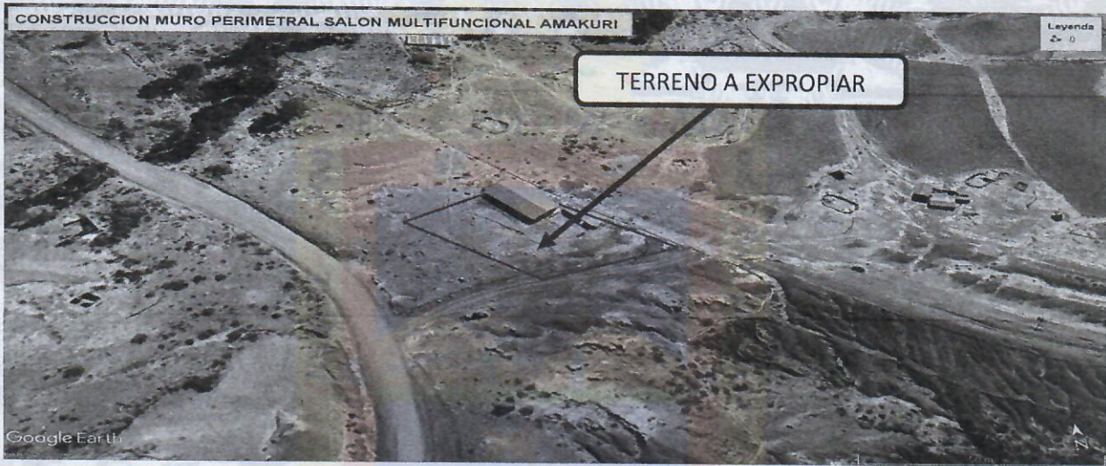
FIGURA 1. IMAGEN SATELITAL UBICACIÓN DE EMPLAZAMIENTO DEL PROYECTO

El mencionado informe concluye y recomienda: