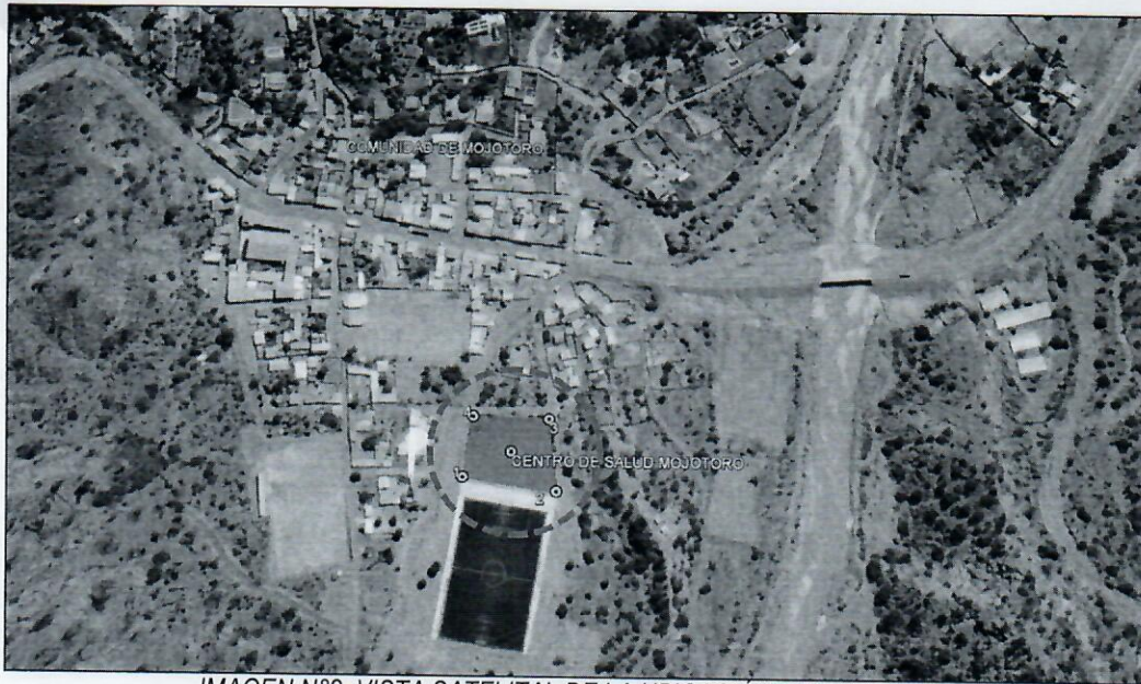
IMAGEN N°2. VISTA SATELITAL DE LA UBICACIÓN DEL PROYECTO.

Que, el INFORME TÉCNICO SUB ALCALDÍA D-7 N° 14/2021, además como justificación establece, que "La Subalcaldía del Distrito 7 tiene en sus prioridades implementar un proyecto de construcción de un centro de salud con internación en la comunidad de MOJOTORO, actualmente se cuenta con un servicio de salud funcionando en la misma comunidad, el cual ya cumplió su vida útil y es menester contar con una nueva infraestructura que cumpla los requisitos mínimos de la norma nacional de caracterización de establecimientos de salud de primer nivel, y de esta manera se contribuye a resguardar la salud de la población en su área de jurisdicción." (Sic).