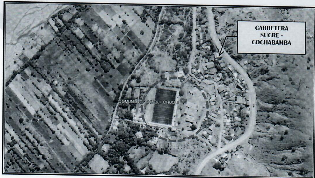
MAPA N°2.VISTA SATELITAL DE LA UBICACIÓN DEL PROYECTO.