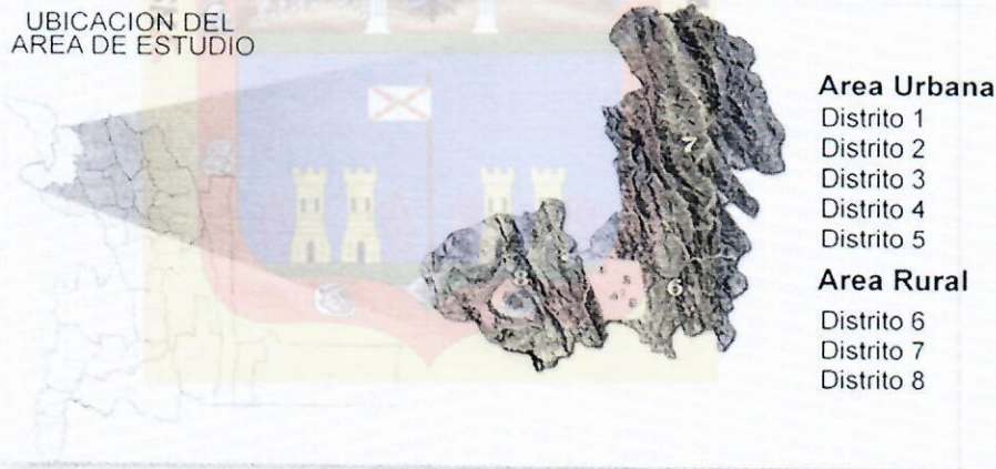
UBICACION DEL AREA DE ESTUDIO

El Municipio de Sucre, geográficamente se ubica al norte del departamento de Chuquisaca, provincia Oropeza, situado entre las coordenadas E-7895295,85 longitud occidental, K-234198,53 de Latitud Sur y altura sobre el nivel del mar 3067 m/s/n/m.