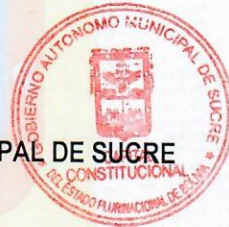
Dr. Enrique Leaño Palénque ALCALDE DEL GOBIERNO AUTÓNOMO MUNICIPAL DE SUCRE

Por tanto, la PROMULGO para que se tenga y cumpla como LEY MUNICIPAL AUTÓNOMICA No. 269/2022, LEY DE AUTORIZACIÓN DE EXPROPIACIÓN DE UNA FRACCIÓN DE TERRENO DESTINADO AL EMPLAZAMIENTO DEL PROYECTO: "CONSTRUCCIÓN MURO PERIMETRAL SALÓN MULTIFUNCIONAL LECOPÁYA, a los 01 días del mes de septiembre del año dos mil veintidós.