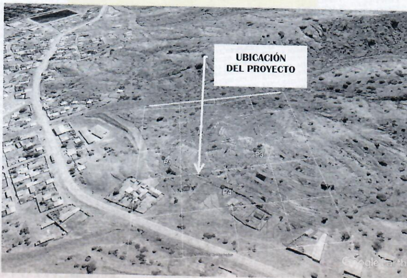
MAPA N°2. VISTA SATELITAL DE LA UBICACIÓN DEL PROYECTO.