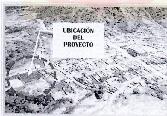
MAPA N°2. VISTA SATELITAL DE LA UBICACIÓN DEL PROYECTO.

La comunidad EL CHACO de la Sub Centralía EL CHACO perteneciente al Distrito 7 del Gobierno Autónomo Municipal de Sucre, está ubicada a 38 Km de la ciudad de Sucre. La ubicación de la comunidad en el ámbito local se detalla en los siguientes mapas, tanto municipal como satelital: