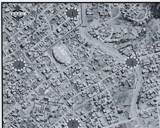
IMAGEN SATELITAL DEL PROYECTO DE REGULARIZACION TECNICA DE ASENTAMIENTOS HUMANOS IRREGULARES BARRIO "OLIMPIC 3"

En este punto se hará mención en la imagen a los colindantes mediatos en relación a la poligonal de intervención: