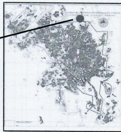
Plano de ubicación Barrio CESSA